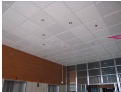
發光二極管照明燈